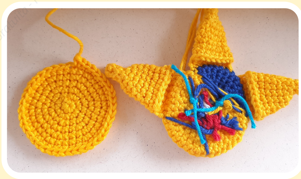
Bordado do rosto e parte de trás da máscara.