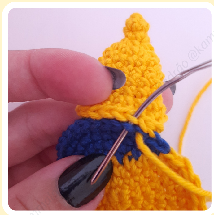
Posição e costura dos raios.